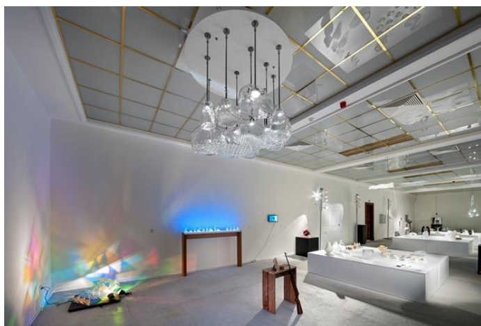
Pohled do instalace výstavy Stanislav Libenský Award 2015