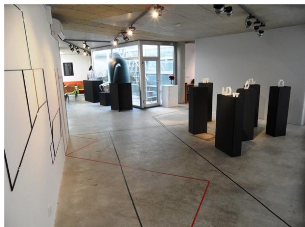
Pohled do instalace výstavy: Vytvořené štěstí: struktura a nicota